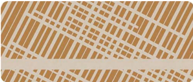
Paneel mit Grafik Carré