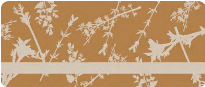
Paneel mit Grafik Herbal

Die Kanten des Wellkartons sind gerundet.