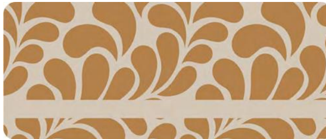
Paneel mit Grafik Floral